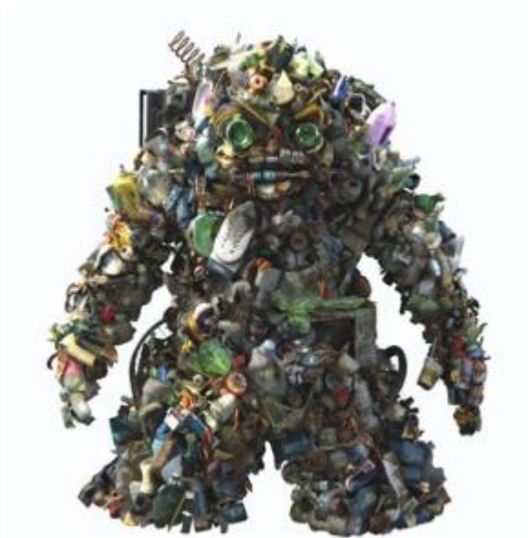
Eco-code sous forme d'une mascotte en produits de récupération.