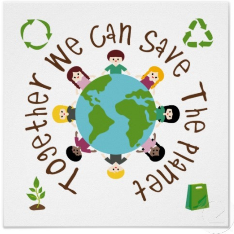
Eco-code sous forme d'un logo avec slogan.