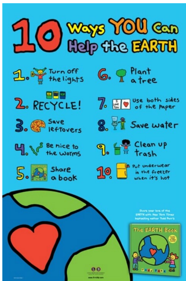
Eco-code sous forme d'une charte dessinée.